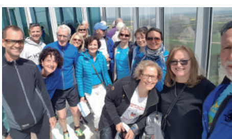
Ja, wir waren auch ganz oben!