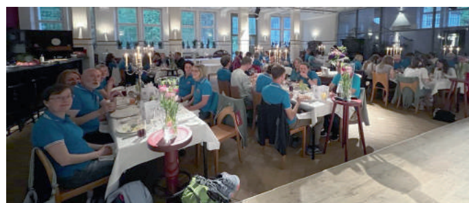
Gemeinsames Essen im Badhaus in Rottweil