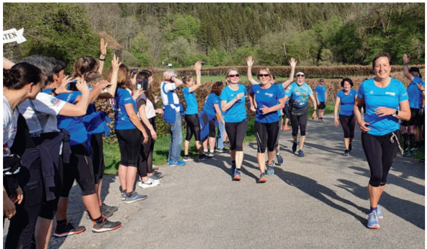
„Der mit den Mädels rennt“ auf der letzten Etappe vor dem gemeinsamen Walk zum Turm