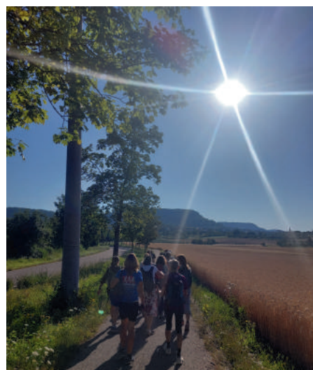
Dieses Wetter - ein Traum!