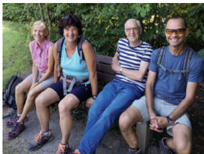
Kurzes Pausle vor dem Ziel