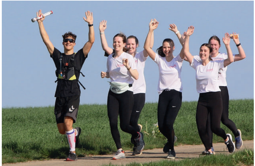
Die Jugend auf ihrer Etappe beim Staffelläufe

In allen Gruppen gibt es wieder Platz! Wer Lust auf spannendes Training mit lustigen Spielen und vielen Übungen aus der Leichtathletik hat, der darf gerne zu uns kommen!