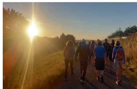
Strammen Schrittes der Sonne entgegen

Nach 25 Kilometern waren wir an unserem Ziel am Naturfreundehaus Herrenberg angekommen. Ein gemeinsames deftiges Weißwurstfrühstück bzw. Käsehappenfrühstück im Garten des Naturfreundehauses war ein gelungener Abschluss einer landschaftlich wertvollen Wanderung.