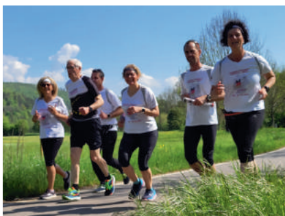
Team „Die mit dem Chef rennen“