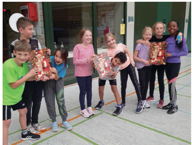
Training mit Adventskalender