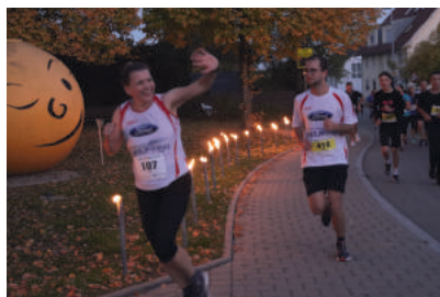
Treff am Eck Stimmungsnest beim Mond

Party und dann auch noch im Zielkanal ... das macht flotte Beine! Herzlichen Dank an dieser Stelle noch einmal für die geniale Zusammenarbeit, das persönliche Engagement und das unkomplizierte Miteinander!