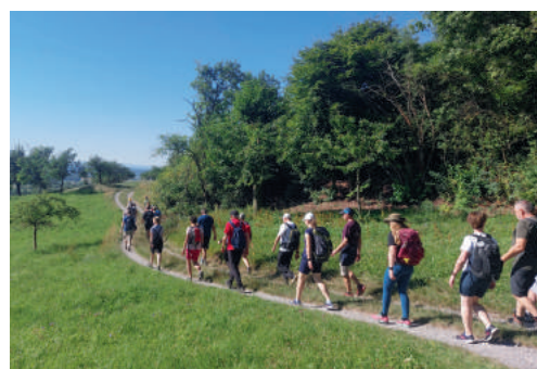
Schönbuch-Trauf: Mönchberg - Naturfreundehaus