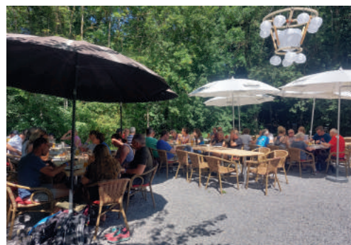
Weißwurst- bzw. Käsehappen-Frühstück beim NFH