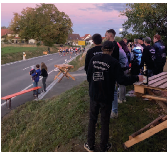
Tolle Aussicht am Stimmungsnest beim Bauwagen

Nicht unerwähnt soll der Bambini-Lauf sein. Ohne Wertung, dafür aber mit viel Herzblut gingen die Kleinsten