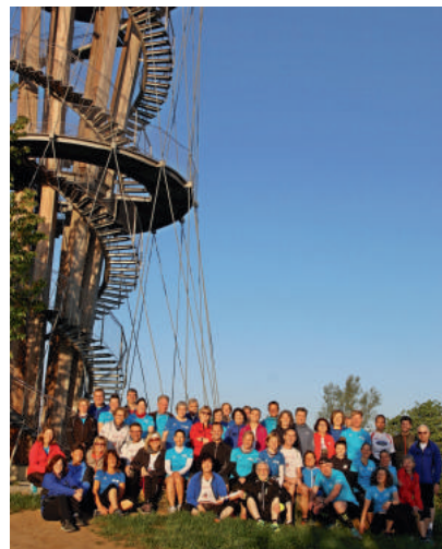
Start am Schönbuchturm zum Prolog

Über das Handy und den entsprechenden Link konnten damit alle jederzeit genau verfolgen, wo sich der E-Staffelstab auf der Strecke befindet und in welcher Entfernung er von der Wechselstelle ist.