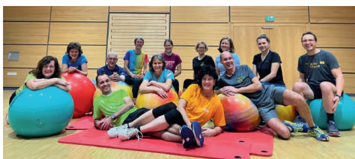
Endlich war wieder Wintertraining in der Halle möglich