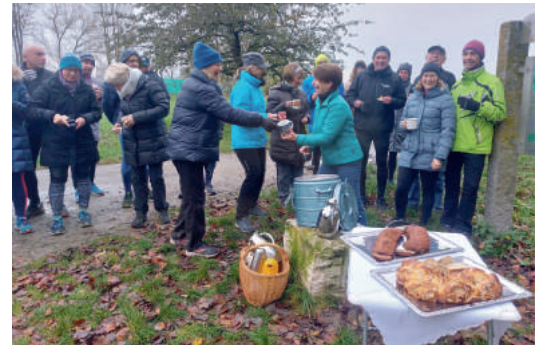
Glühweinlauf mit Liesels weltbestem Glühwein

Neben dem Laufen hat das gesellige Miteinander beim Lauffreff eine hohe Priorität. Dass unsere schon fast traditionsreichen Veranstaltungen wichtig und richtig sind, zeigt uns die durchweg gute Resonanz.