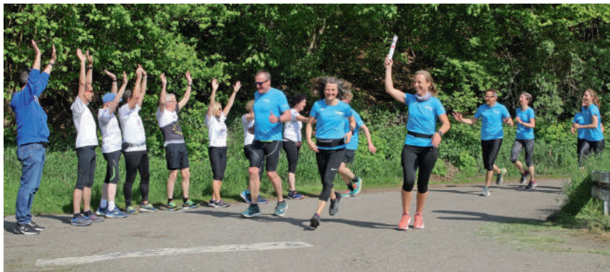
Übergabe bei Obernau (Etappe 4)

Auch die Etappe zur letzten Wechselstelle an der Neckarburg, gleichzeitig Treffpunkt aller Teams für die Schluss-Etappe, war bemerkenswert. Sie offenbarte bereits einen ersten Blick auf den Testturm in Rottweil und verschaffte „dem, der