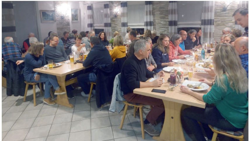
Saison-Abschluss im Sportheim