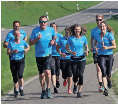
Das Team der Flinken

mit den Mädels rennt“ einen 50-köpfigen, jubelnden Spalier.